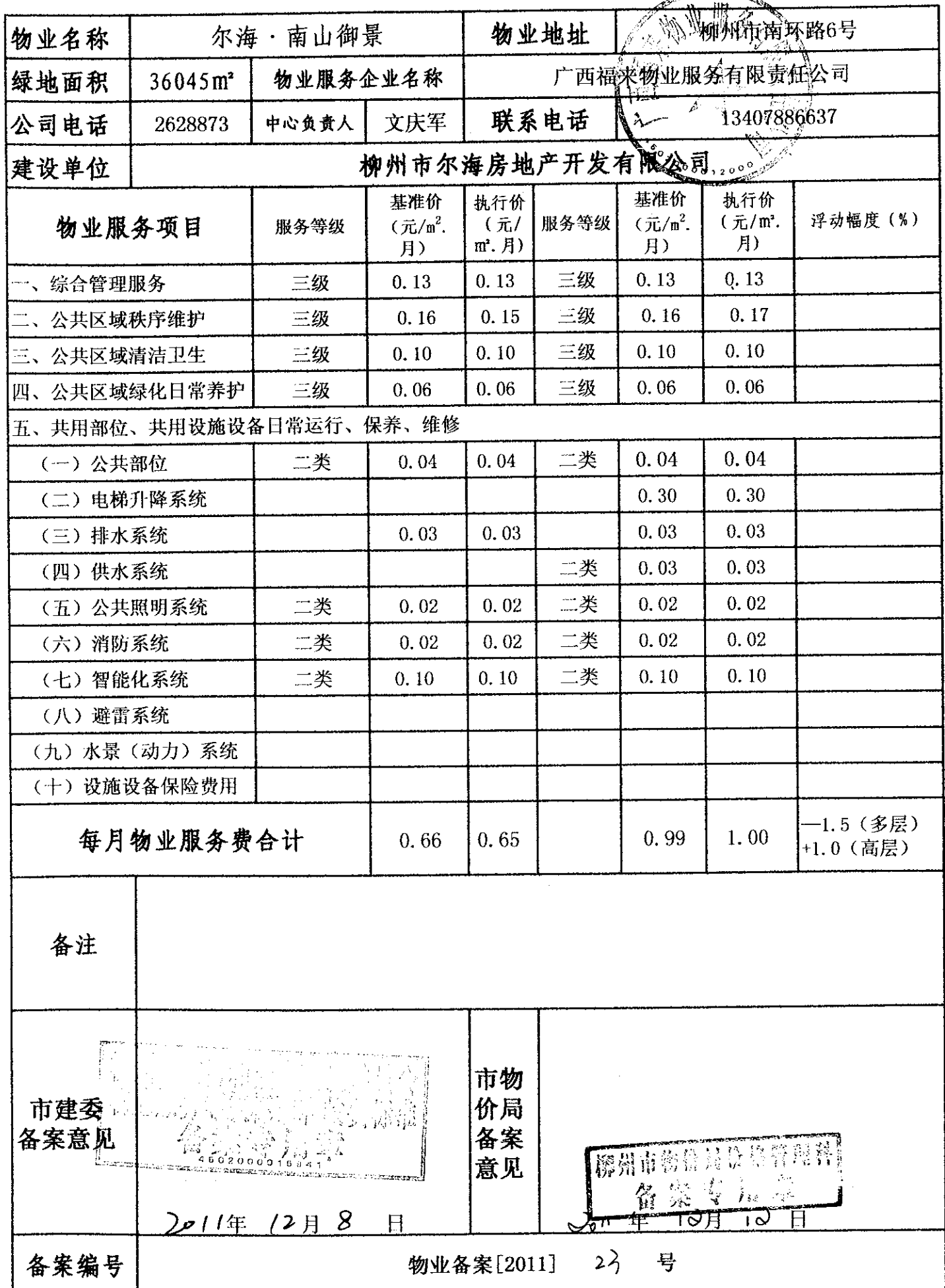
柳州市物业服务等级标准和收费标准备案表